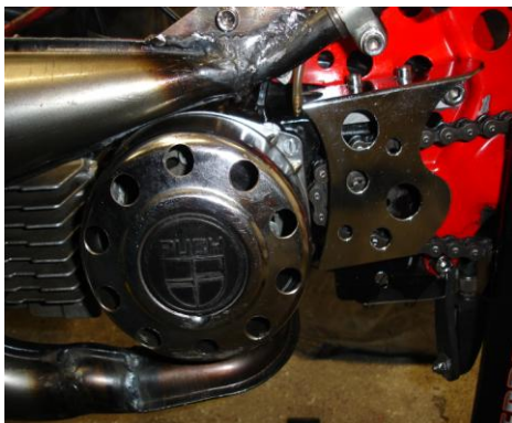
Abdeckung Schwungrad / Ritzel Die Schwungradmutter muss abgedeckt sei.

Motor : max. 100CCM Vergaser: max. 24mm Zündung: frei Gehäuse: Mofamotorengehäuse, das im Herkunftsland homologiert als Mofamotorengehäuse gilt. Der Fahrer muss die Typenprüfbescheinigung als "Mofamotor" homologiert, vorweisen. Stehbolzenlochabstand frei. Auspuff: frei (nach Reglement)